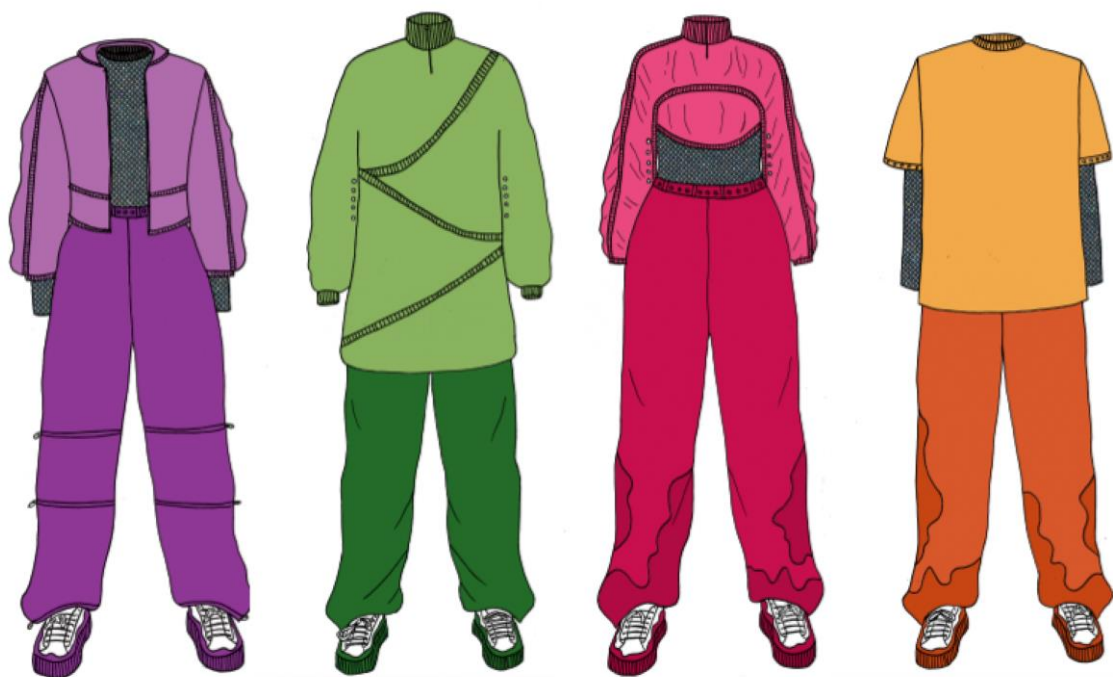
Kostymetegninger av kostymedesigner Synne Reichelt Føreland (illustrasjon).